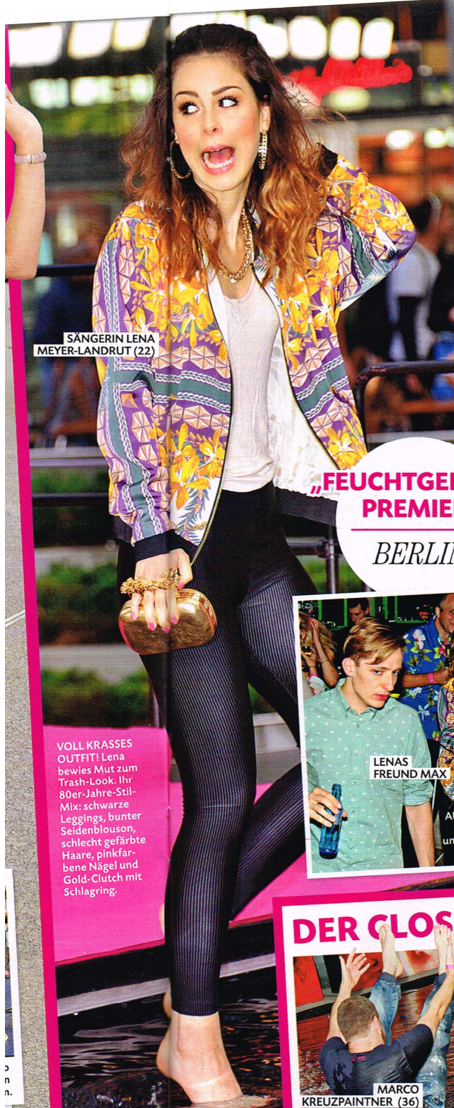
SÄNGERIN LENA MEYER-LANDRUT (22)